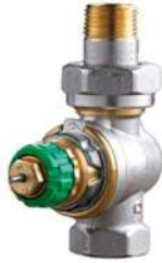
(Indicatie radiator afsluiter thermostatisch)

Alle radiatoren worden voorzien van nieuwe radiatorkranen. Dit zijn thermostatische radiatorkranen, die waterzijdig worden ingeregeld.