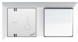
(Co2 sensor naast lichtsakelaar)

De CO2 sensoren worden bij voorkeur naast de lichtsakelaar van de betreffende ruimte geplaatst vanwege de benodigde 230V aansluiting. Alle afzuigrozetten van de mechanische ventilatie worden vervangen door nieuwe afzuigrozetten. De ventilatiekanalen worden (voor zover bereikbaar) gereinigd en de installatie wordt opnieuw ingeregeld.